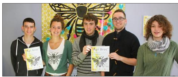
Les élèves en charge de l'organisation.

Les élèves du lycée agricole Olivier-de-Serres étaient présents sur un stand à l'heure de l'apéritif pour lancer leur "Api'Broc" qui aura lieu les 4 et 5 avril au parc de Vals-les-Bains. Au programme du samedi 4 : à 17 heures, conférence sur les vins naturels par Gilles Azzoni ; à 18 h 30 repas sur réservation (adulte 10 €, enfants 5 € au 06 12 60 34 45) ; à 20 heures, taille de ruche tronçonnage en direct ; à 20 h 30, concert Api'zik. Le