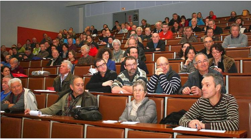
Plus de 150 apiculteurs ont suivi l'assemblée générale du GDS 07 samedi au lycée agricole Olivier-de-Serres.

Le GDS RA (Groupement de défense sanitaire Rhône-Alpes) a été désigné comme organisme à vocation sanitaire (OVS) pour l'ensemble des filières animales. Une section apicole