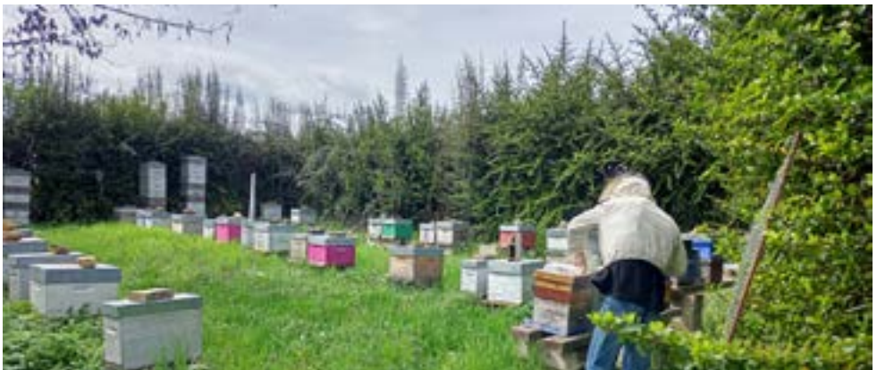
Rucher-école avant l'arrachage de la haie de pyracanthas.

Comme chaque année, nous avons réalisé un achat groupé de candi . Plus de 80 de nos adhérents ont répondu présents. La distribution au Pradel s'est bien déroulée. Vous avez été bien disciplinés en venant en temps et en heure retirer vos commandes, malgré un avertissement tardif lié à l'incertitude de la livraison par le transporteur. Nous sommes certains qu'à l'avenir vous continuerez à avoir à cœur de faciliter la tâche de nos bénévoles. Cette opération sera reconduite cette année.