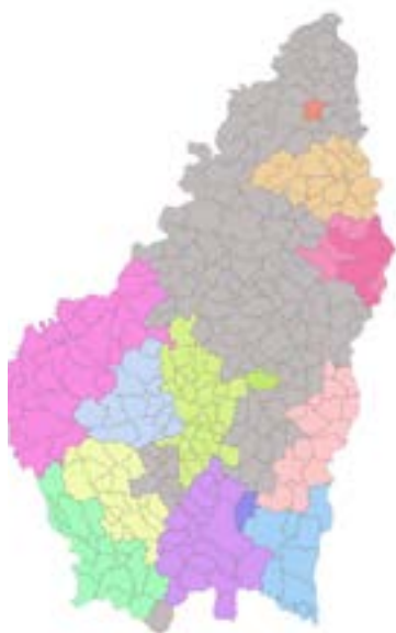
Les zones colorées sont celles disposant d'une aide financière

➔ N'hésitez pas à vous inscrire sur lefrelon.com