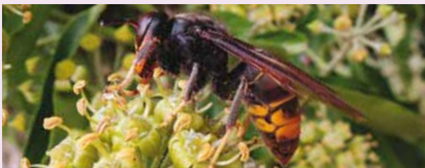
Frelon observé sur lierre à Cornas en octobre 2016

On peut renouveler l'opération plus près du nid. Il faut savoir que les frelons ne montent pas directement vers leur nid ; c'est pourquoi, on perd souvent les trajectoires en se rapprochant. De plus, un certain recul est nécessaire pour repérer le nid.