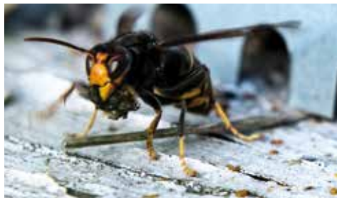
Les glissières anti frelons sont indispensables, sinon...

Si et seulement si le rucher est fortement impacté, des pièges peuvent être disposés à proximité en fin d'été pour capturer un grand nombre d'ouvrières et ainsi soulager les colonies. L'apiculteur